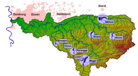
Einzugsgebiet der Ruhr mit Staudämmen

Im Mittelpunkt des Datenmanagements steht eine GeODin-Datenbank, in die tagesgenau alle gemessenen Daten übertragen werden. Eine spezielle Erfassungsmethode sorgt vor Ort für die Aufnahme, Verwaltung und Bewertung von Vermessungsdaten sowie deren automatisierten Transfer in die zentrale Datenbank. Zur weiteren Erhöhung der Datenqualität und Reproduzierbarkeit von Änderungen im Datenbestand werden in GeODin ein Einpflegeprotokoll und eine Änderungsverfolgung verwendet. Ein Sicherheitsbericht mit Diagrammen und Statistiken wird automatisch von GeODin erstellt.