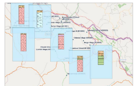
GeODin-Karte mit Bohrprofilen